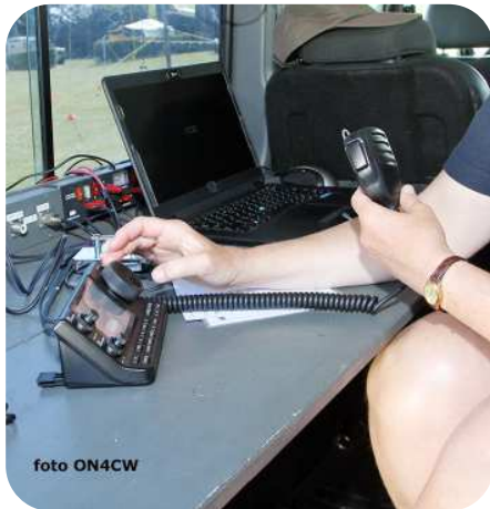
De Bencher paddle is helaas verstopt achter de hand van de operator ..... volledige foto volgt ...

Redactie: Pauwelsbos 4, 9881 Beillem - Verantwoordelijke uitgever ON4CW Erik Verbeeck 0473 76 25 73 info@morsum-magnificat.be