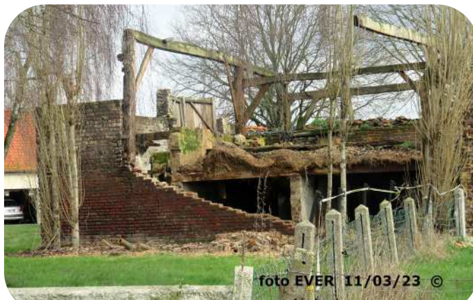
Bellem: Dit is geen alleenstaand geval en zonder verder commentaar

Onder meer over hoe het mogelijk is dat de gemeente tegen die - en andere - leegstand nooit eerder iets heeft ondernomen. Morsum Magnificat heeft vele jaren geleden die problematiek ook al blootgelegd, zoals in mei 2010 te Tessenderlo waar een groot drugslab in een leegstaand bedrijfsgebouw werd ingericht - foto inzet -. Met veel show werd daags nadien bij de FGP in Hasselt de vangst getoond, Morsum Magnificat kende toen reeds de naam van één van de betrokkenen. We zien in Aalter