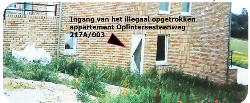
Dit stuk gevel van het illegale bouwwerk heeft Stad Tienen niet gezien ...