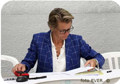
Gella als organisator