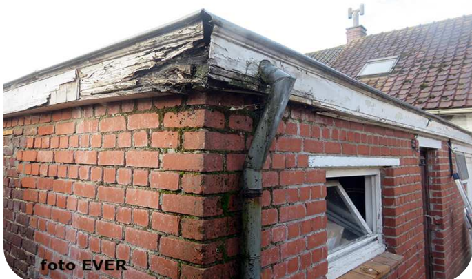
Plat dak bijgebouw binnenkoer