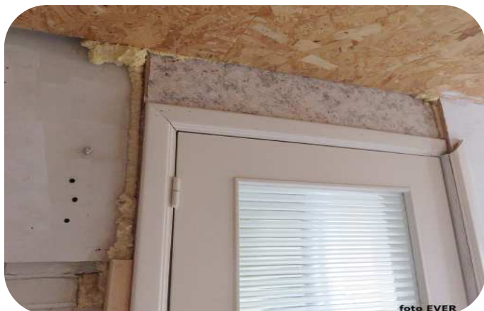
Afwerking gang naar badkamer en slaapkamer 2