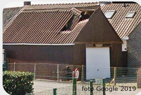
Foto links: Een van de inbreuken gaat over de garage waarvan het puntdak bestaande uit ongebonden asbestplaten, werd verwijderd en vervangen door een plat dak bestaande uit metalen profielen die op een meer dan amateuristische manier werden geplaatst waardoor er onder andere water binnen sijpelt wat de huurders schade berokkent.

Nadat de eigenaar Baziel D'Hooge in 2016 is overleden