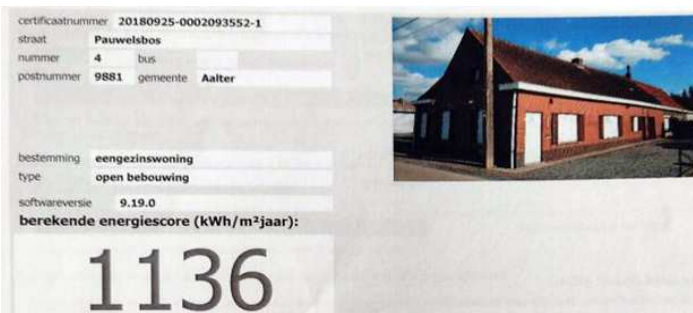
Zelfs met dit barslecht EPC hield de woningcontroleur geen rekening