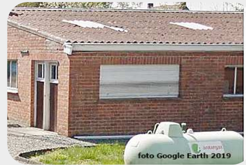
Foto rechts: Dat is de onderhouden werkplaats van Baziel D'Hooge waarvan de asbesthoudende golfplaten werden verwijderd en, zoals bij de garage, vervangen door metalen profielplaten. Er werd een garage bijgebouwd, een afdak en er werden allerlei materialen en een afgedankte koelwagen gestockeerd.

werd het pand in 2018 aangekocht door twee in Aalter samenwonende personen. De éne eigenaar werd onder de naam VDC Project -KBO 690 809 749- samen met nog vier andere personen zelfstandig. Diezelfde eigenaar GVDC stichtte op 22 juni 2022 nog een ander bedrijf -KBO 787 518 848-. De andere eigenaar QL, werd pas op 2 januari 2013 zelfstandig traiteur -KBO 501 714 385-. De "traiteur" die volgens zijn website lekkere frietjes bakt, ontpopte zich ook als bouwvakker, alleen is het gepresteerd werk in het pand wraakroepend en werden diverse bouwinbreuken begaan die door de dienst omgeving van Aalter, Stieven B. en Tania B. bevestigd werden.