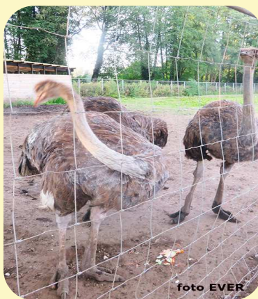
De 3e politieke oppositiestruisvogel in Aalter moeten jullie er maar bij denken