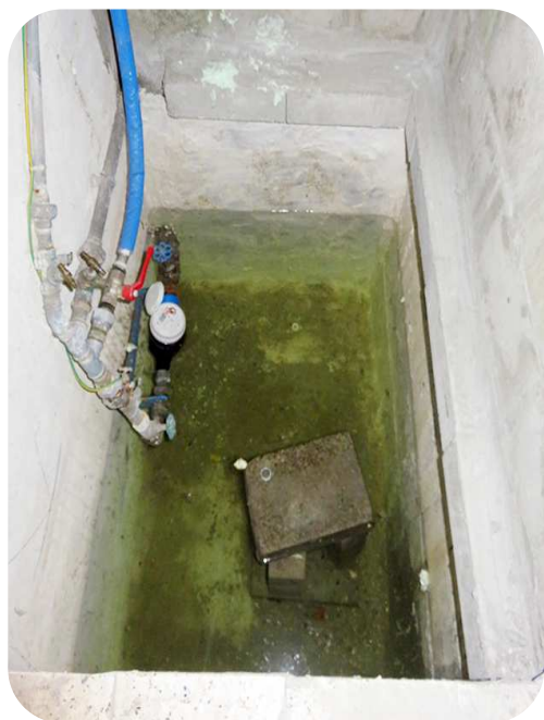
Put watermeter er is 60 cm mater hoofdkraan kan niet bereikt worden