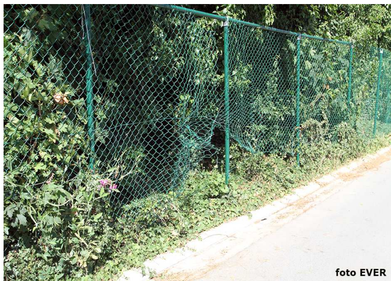
Er is al heel wat schade aangericht, onder meer deze omheining die zowat over de ganse lengte beschadigd is. Wat verder aan de parking bij Bpost ligt de betonnen afsluiting tegen de grond.

heyt aan Morsum Magnificat. Het water tussen de CD&V en het Vlaams Belang is dus niet zo diep en dat is niet de eerste keer dat we dat vaststellen.