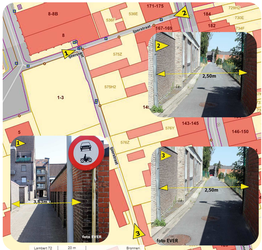
Overzicht 1 - Project ondergrondse parkings op oude site Academie - Plan Geo Vlaanderen Op de plaats van foto 1 is de straat rekening houdend met de verlichtingspaal, 3,50m breed