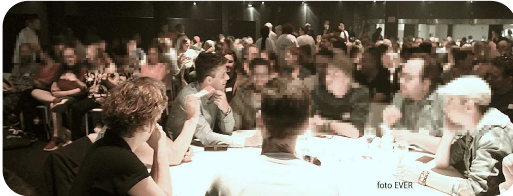
Minister Benjamin Dalle -CD&V- hier gezellig aan tafel tussen het publiek en later op het podium