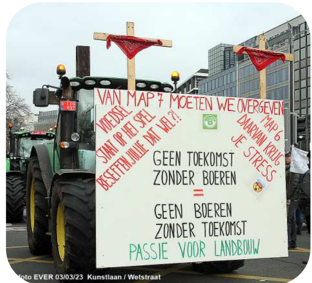
03/03/23 Kunstlaan / Wetsstraat