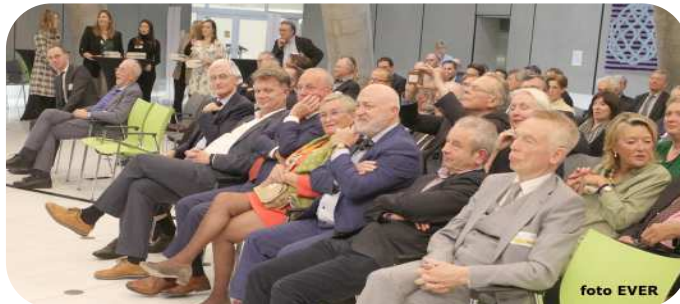
Een deel van zaal De Schelp tijdens het 2e deel

tie, nog nooit is eigenlijk het Vlaams nationalisme, zoals het zo mooi door u wordt verwoord, gesteund door de kiezers, nog nooit hebben de Vlaams nationale partijen zoveel stemmen gehad, maar tegelijkertijd ben ik toch ook wel heel verontrust als ik het verhaal hoor van mijnheer Buysse, dat is toch een zwaard van Damocles dat boven ons hoofd hangt, dus die her-federalisering, dat terugschroeven van de Vlaamse bevoegdheden waarvoor we zolang gestreden hebben. Ik ben er dus, als ik kijk naar 2024, eigen-