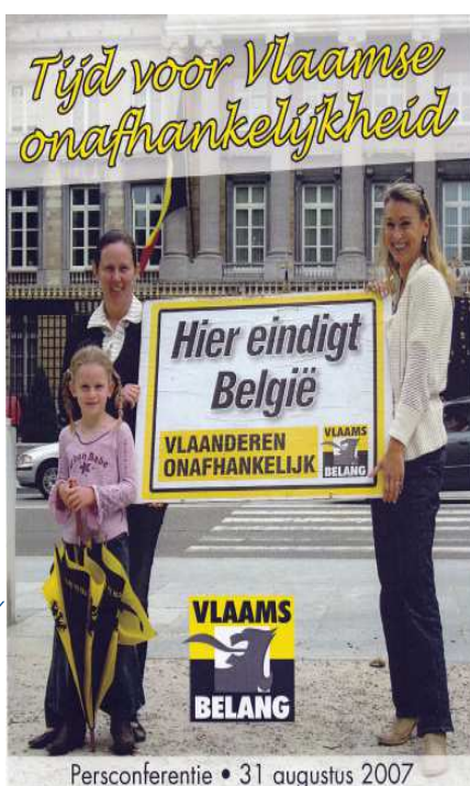
Sinds die tijd is de onmogelijkheid Vlaanderen onafhankelijk te maken alleen maar sterker geworden, daarvoor hebben Wallonië en Brussel gezorgd.

Een naam die in de negatieve zin ook al door Claire Tilckaerts werd genoemd, is Sophie Wilmès - ook bekend bij Morsum Magnificat http://www.morsum-magnificat.be/index.php?option=com_content&task=view&id=8009&Itemid=0 Wilmès wordt gelinkt aan het feit dat wij nu al dertien jaar onder een regime leven dat één bepaalde Frans-