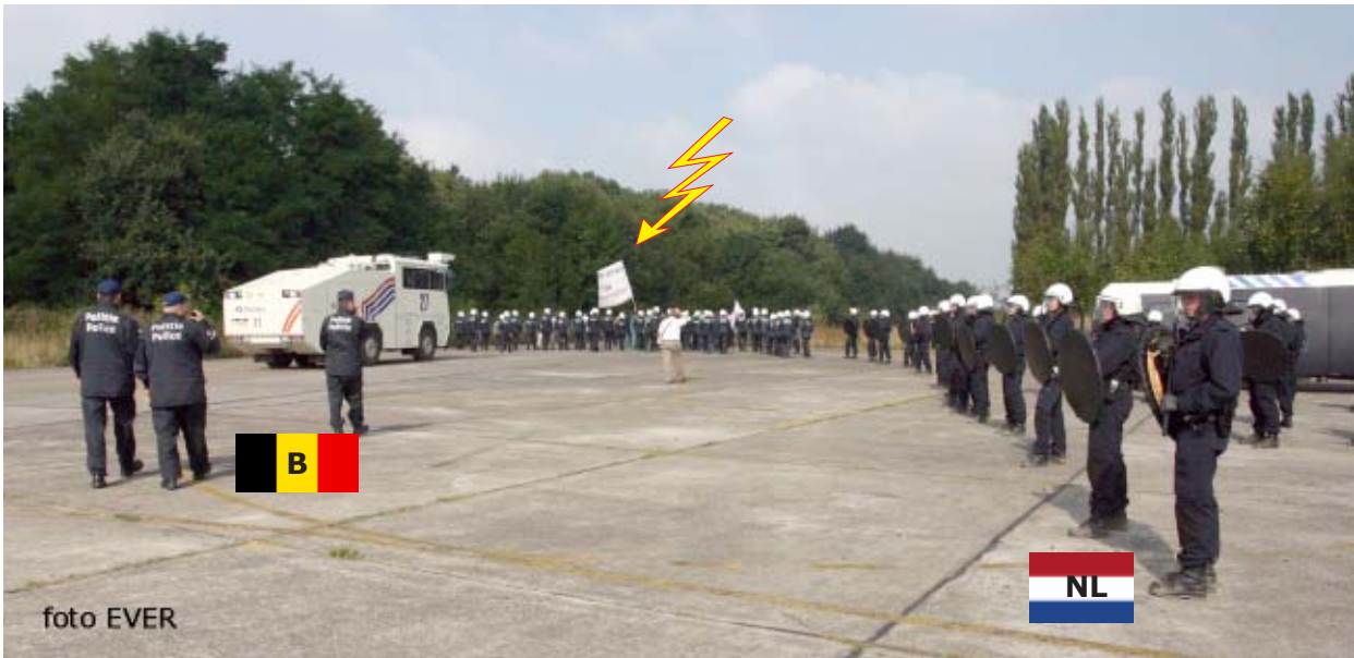
Internationale oefening te Brustem - oefening van een omsluiting van demonstranten.

Hier hadden drie manifestanten zich vastgemaakt aan een -vervallen-verkeerstoren van het vliegveld. Eén van hen hing in een klimharnas met de nodige beveiligingen halweg de +/- 15meter hoge toren, maar zonder veel problemen liet een van de lock-on-team leden zich op dezelfde hoogte als de manifestant zakken, haakte de actievoerder vast aan zijn eigen beveiligde