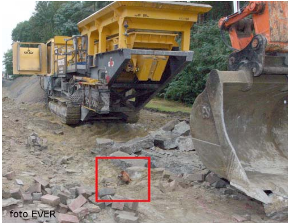
De hoogspanningskabel -15kV- kruiste de weg op ongeveer 37cm diep ! Een oranje plastic buis was de enige bescherming, er was geen andere bescherming noch éni- g waarschuwingsslint.

Volgens het KB van 27 maart 1998 betreffende het welzijnsbeleid, dient de werkgever te zorgen voor een structurele en planmatige aanpak van de preventie in zijn onderne- ming door middel van een dynamisch risicobeheer- systeem. Eén van de basiselementen van dit systeem is de risicoanalyse en de preventiemaatregelen die eruit voortvloeien. In zijn dynamisch risicobeheersingsysteem moet de werkgever een strategie ontwikkelen in verband met het verrichten van die risicoanalyse.