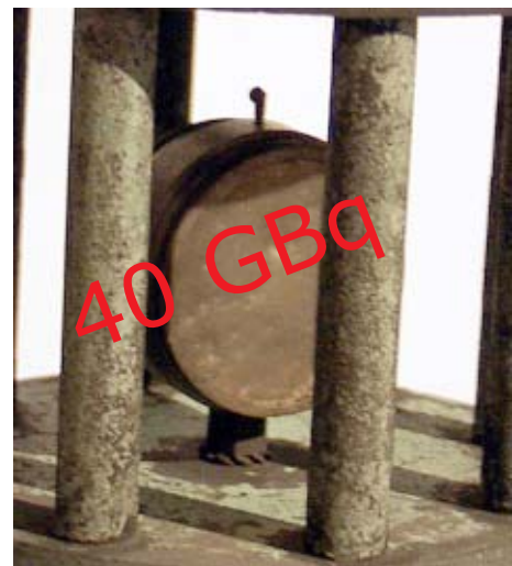
De Beryllium container van 5cm 3 heeft een bronactiviteit van 40GBq, bij duizenden is de Krypton 85 ontsnapt wegens ondermeer het gebrekkige mechanisch systeem -ventiel-.

Jean-Marc Nollet van Ecolo heeft moord en brand geschreeuwd over de 45 Giga Becquerel die op 24 augustus 2008 door de schouw van het IRE werd geloosd, maar in de praktijk zijn er al veel erger zaken gebeurd dan dat en daar kraait geen Waalse Haan over, laat staan een Vlaamse Kip.