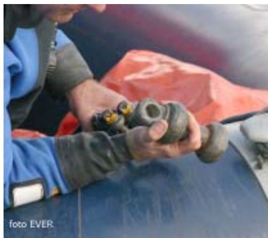
Geen handschoenen nodig ?

Het meest frappante is dat de 5kVA stroomgroep wel voorzien is van een aardingspijket, maar bij de demonstraties bleef die gewoon op de kade liggen -zie foto-. Dat wil dus zeggen dat de eventuele differentieelschakelaars, die de Fransen in de elektrische schakelkast hebben voorzien, niet kunnen