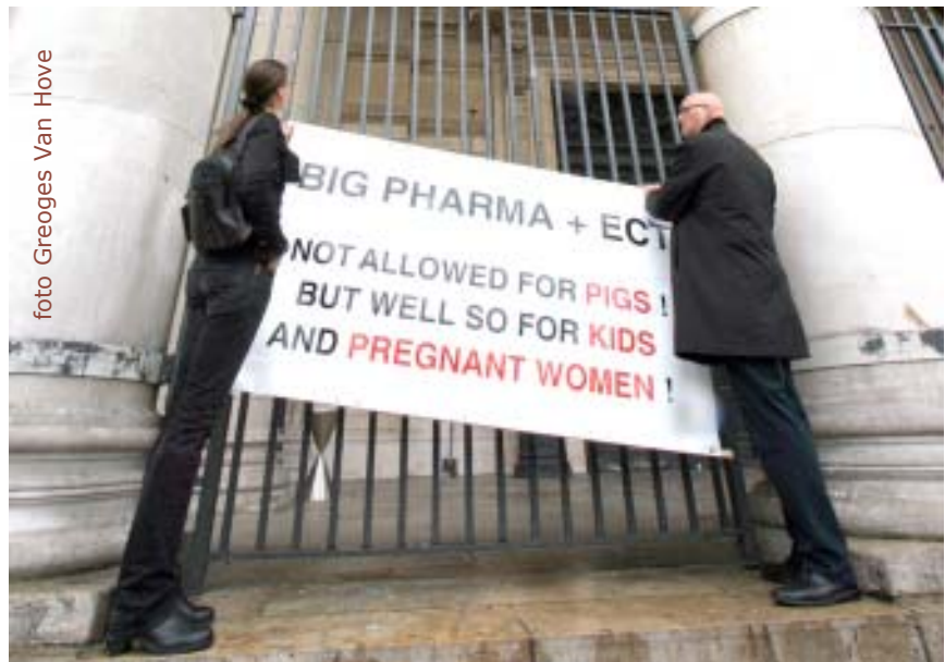
Zwarte mars van de Sarah beweging 7 sept 08 -MM 157- die vooral tegen het misbruik van de Pharmaceutische industrie was gericht.

De Strattera geheimen bevatten o.m. dat men de "ziekte" van het normale gedrag behandelt door "patiënten" te behandelen met psychotica om hen daarna, via de nevenwerkingen, aan de nog duurdere antipsychotica te brengen. Dit levert gigantische winsten op voor de farmaceutische industrie en